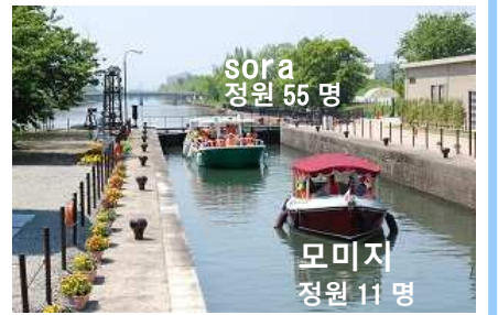
나카지마 갑문 (물 엘리베이터)